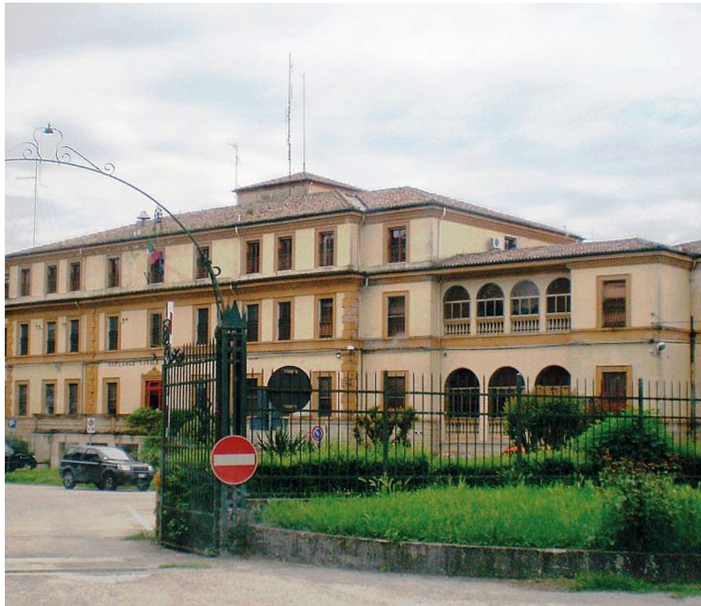
L'ospedale "Fratelli Borselli" di Bondeno, la protesta è per i troppi disagi al Cup