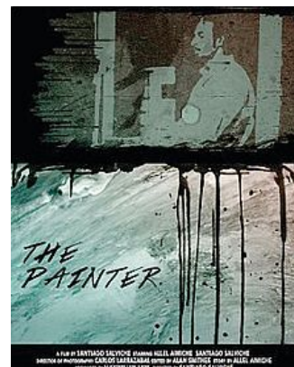
Locandina del film "The Painter"

gage e The Painter al canale televisivo satellitare "ShortsHD", ma la ciliegina sulla torta è che The Academy (organo fondatore degli Oscar) ha pre-selezionato il cortometraggio Tomorrow will be another day (Domani sarà un altro giorno) nella ca-